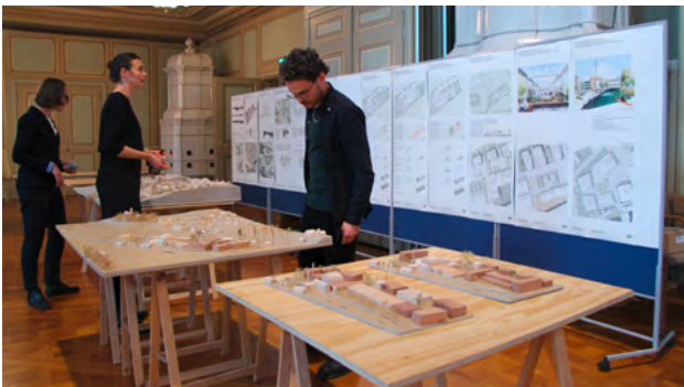
Vorstellung der Vorschläge durch die TUM

Zusammen mit der Technischen Universität München wurden im «Entwurfslabor» mit den Gemeinden Gachnang, Frauenfeld, Hüttwilten und Pfyn praxisnah und in Varianten Ideen und Lösungsansätze zu Fragen der Dorfentwicklung erarbeitet. Mit analogen und digitalen Modellen liegen Vorschläge von den Studierenden aus den Bereichen Architektur, Städtebau und Freiraum anschaulich und so auch für Laien verständlich vor. Die Ergebnisse und die fertiggestellte Broschüre, in der unter anderem beispielhafte Handlungsfelder und die neun Prinzipien der Ortsentwicklung in der Regio Frauenfeld beschrieben sind, wurden an einer Veranstaltung vorgestellt.