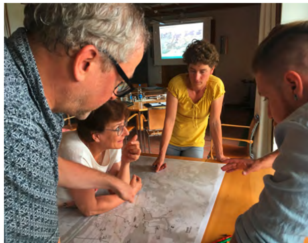
Workshop in Herdern

Im Modul Freizeit wurde recherchiert und analysiert, wie die Angebote besser sichtbar und bekannter gemacht werden können. Mit Fachleuten aus Tourismus und Freizeit, Anbietern von Plattformen sowie Entwicklern wurden Interviews geführt und bestehende Tools analysiert. An einem Soundingboard im Sommer wurden die Ergebnisse reflektiert und diskutiert. Die engagierten Diskussionen der Eingeladenen haben u. a. auch gezeigt, dass es wertvoll ist, diese Anliegen über Fachdisziplinen und staatliche Ebenen hinaus zu diskutieren und zu beleuchten.