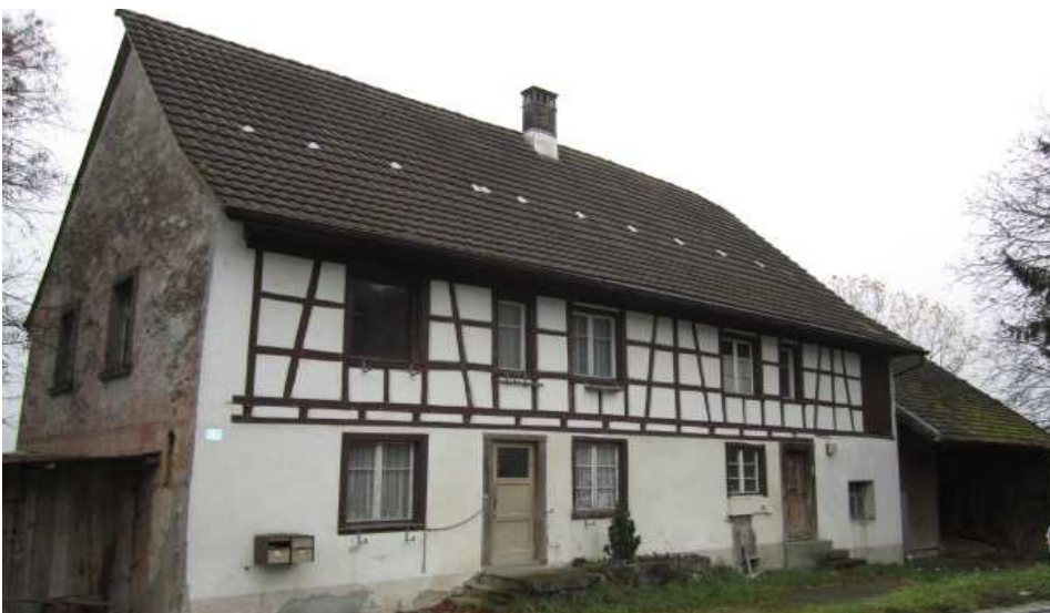
Herdern, Kalchrainstrasse