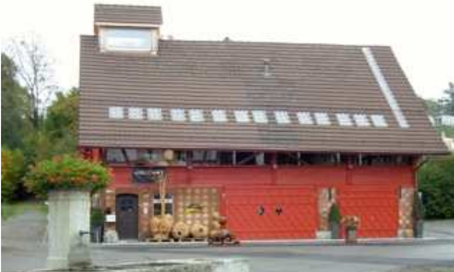
Hüttwilen, Sonnenplatz bild unscharf