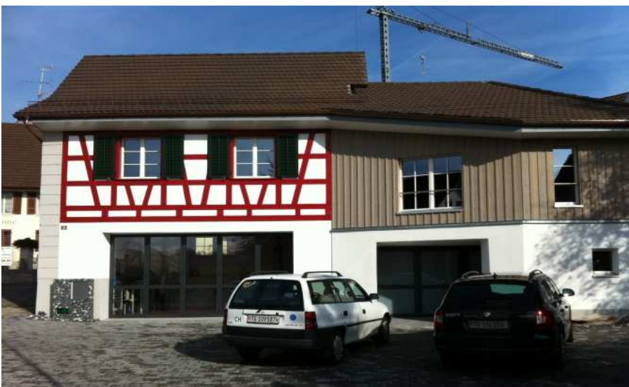
Hüttwilen, Unterdorf