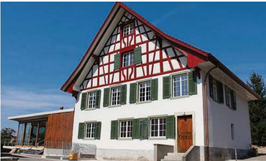
Stettfurt, Hauptstrasse